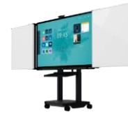
Extensia iPro Whiteboard