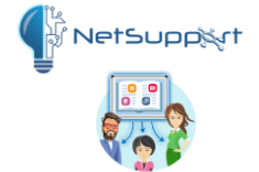
NetSupport Classroom & mozabook