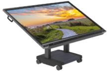
Prowise iPro Tilt & Toddler Lift

Standuri mobile, camere web, module OPS, telecomenzi, softuri educaționale și alte echipamente