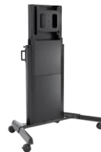
Chief XL Electric Cart