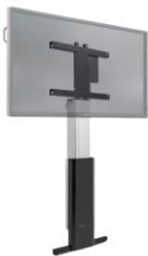
CTOUCH Wallom2 Wall Lift