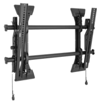
Chief Medium Fusion Wall Mount

Standuri mobile, camere web, module OPS, telecomenzi, softuri educaționale și alte echipamente