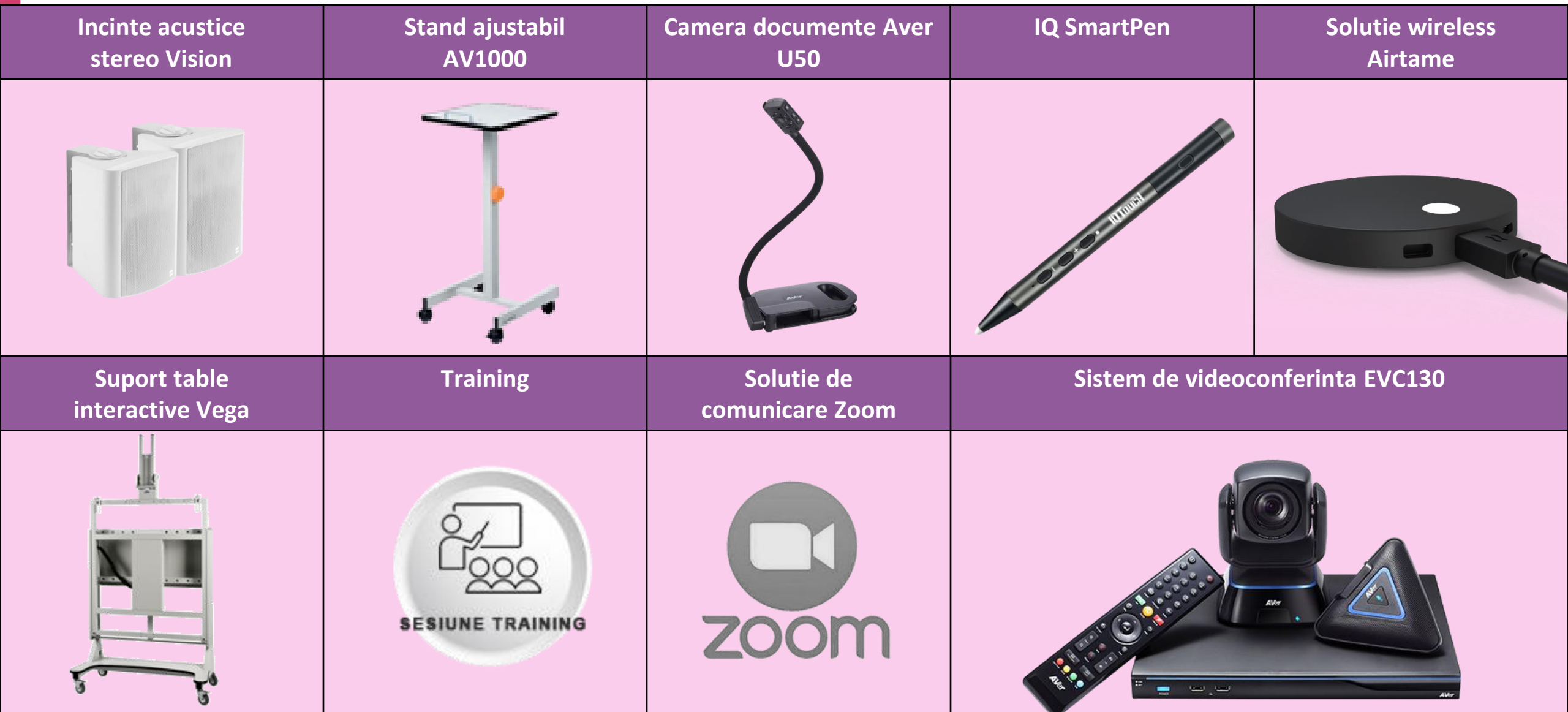
Table Interactive Foundation – Accesorii optionale