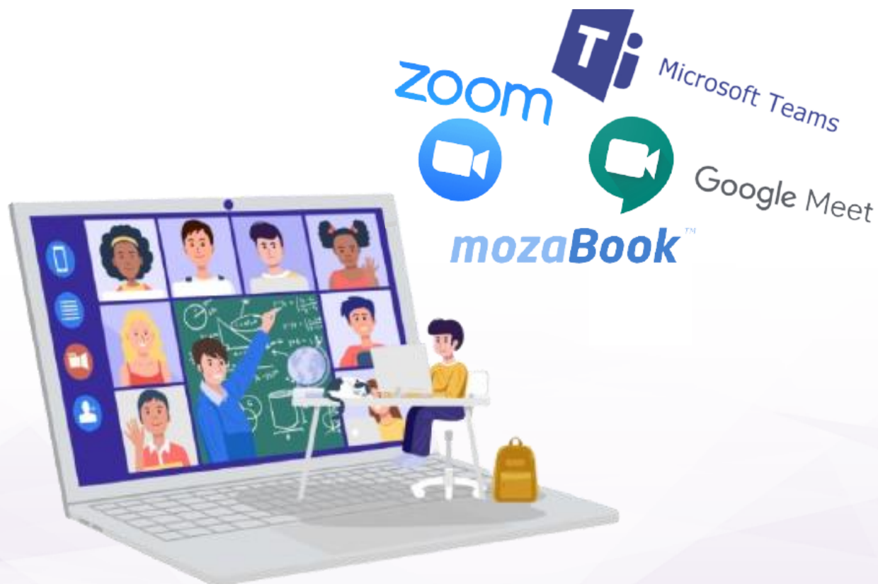
Table Interactive Foundation - Software Limba Romana - Multi-touch 10 puncte

Tablele interactive Foundation se integreaza nativ cu solutiile de invatamant la distanta prin Zoom, Google Meet, mozaBOOK, Microsoft Teams si orice alta aplicatie de invatamant la distanta sau videoconferinta sprijind modul de predare interactiv.